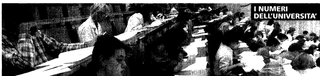
I NUMERI DELL'UNIVERSITÀ

Piace il nuovo metodo, che supera i localismi, sul resto il contrasto rimane totale