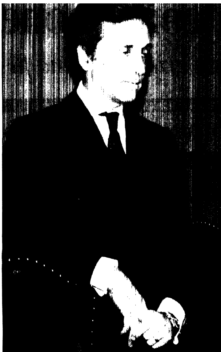
Il ragioniere generale dello Stato Vittorio Grilli

Nello studio la famiglia conta ancora troppo