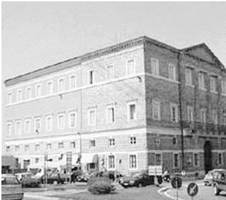
La sede univesitaria di Macerata